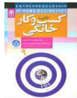
کسب و کار خانگی