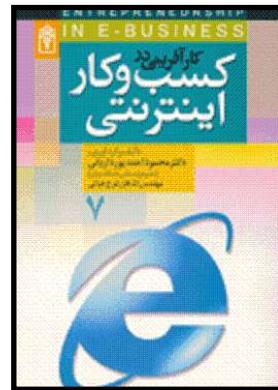
کسب و کار اینترنتی